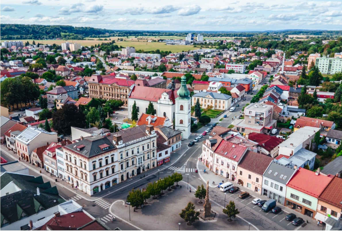
Autor: Sebastian Vanický

Přihlásit se na komentovanou prohlídku Orlického muzea